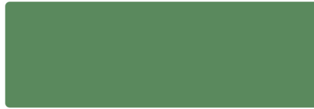
Resedagrün - RAL 6011