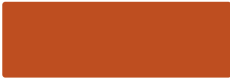
Rotorange - RAL 2001