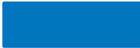
Lichtblau - RAL 5012