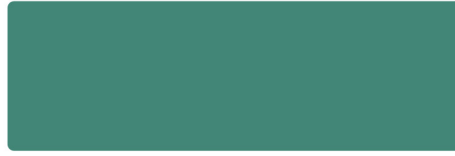
Graugrün - Hausfarbe RAL 0001