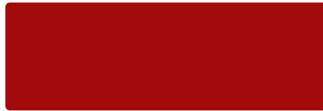
Rubinrot - RAL 3003