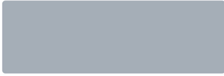
Lichtgrau - RAL 7035 (Standardfarbe)