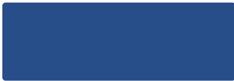
Brillantblau - RAL 5007